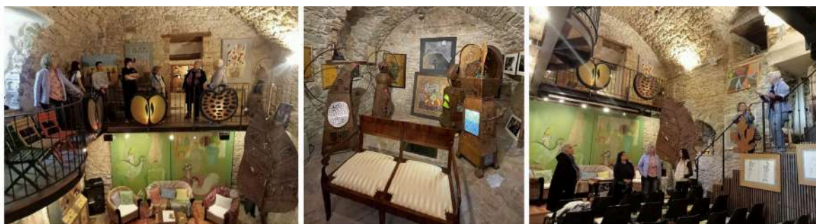
Visite du musée de Tonino Guerra - 18 mai 2025

Tonino Guerra (1920-2012) était un poète, écrivain et scénariste italien originaire de Santarcangelo di Romagna. Figure majeure de la culture italienne du XXe siècle, il a collaboré avec de grands réalisateurs tels que Federico Fellini. Profondément attaché à son territoire, il a également œuvré pour la valorisation du patrimoine naturel et culturel de la région, notamment à Pennabilli, où il s'est installé et a initié plusieurs projets artistiques et poétiques autour de la mémoire, de la nature et du paysage.