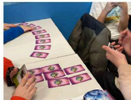
Classe 2N - Santarcangelo