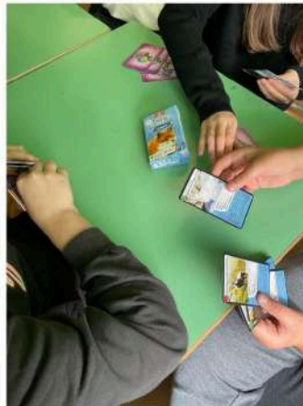
Classe 1C - Scuola media Villa Verucchio