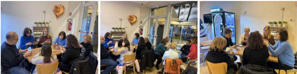
Bar Venusian (2 février 2025) - découverte des jeux bioviva

Cette expérience a néanmoins constitué une base intéressante pour de futures animations avec les scolaires.