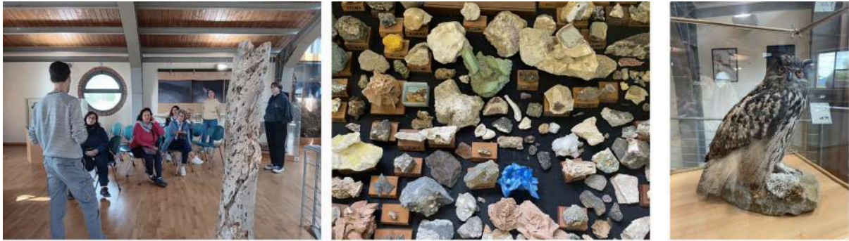
Visite du musée du Parc Sasso Simone e Simoncello - 18 mai 2025