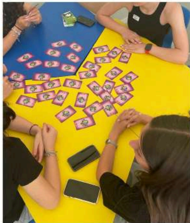
Classe 4LA - Liceo Faenza