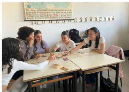
Liceo linguistico Valgimigli