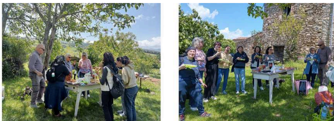
Repas conviviale à Casa Fanchi - 18 mai 2025

Après un déjeuner convivial à Casa Fanchi, où se trouve le Giardino della Biodiversità, et où chaque participant avait préparé un plat fait maison à partager, nous avons poursuivi la journée par une promenade à travers les sentiers du Parc Naturel Interrégional Sasso Simone e Simoncello. La sortie s'est conclue par la visite du musée du Parc , permettant de découvrir la richesse naturelle et culturelle de ce territoire préservé.