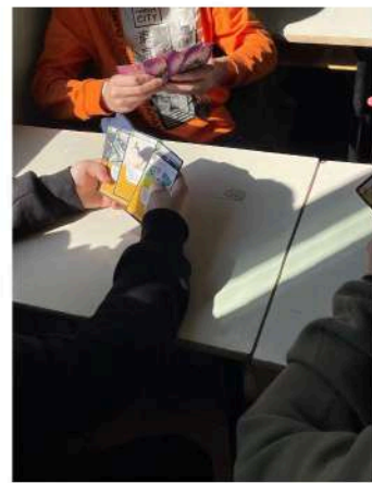
Classe 3A - Scuola media Novafeltria