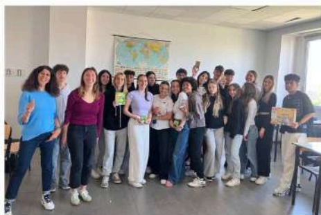
Liceo linguistico Valgimigli