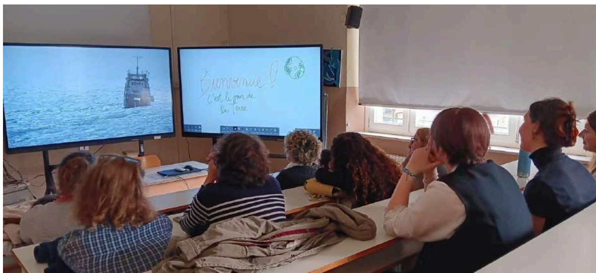
Projection documentaire Home - 23 avril 2025

Ainsi, l'Alliance de Rimini a organisé au sein de l'ITT Marco-Polo, la projection du documentaire Home . Ce documentaire a été écrit et réalisé en 2009 par Yann Arthus-Bertrand, photographe et militant écologiste. Ce film propose une vision saisissante de l'état de notre planète, vue du ciel. Il met en lumière les pressions exercées par l'activité humaine sur l'environnement, ainsi que les conséquences qui en découlent, notamment le réchauffement climatique. Plutôt qu'un film alarmiste, Yann Arthus-Bertrand souhaite transmettre un message d'espoir. À travers des images aériennes spectaculaires, il aborde des problématiques environnementales majeures : la raréfaction de l'eau, la déforestation, la fonte des glaces ou encore l'épuisement des ressources naturelles.