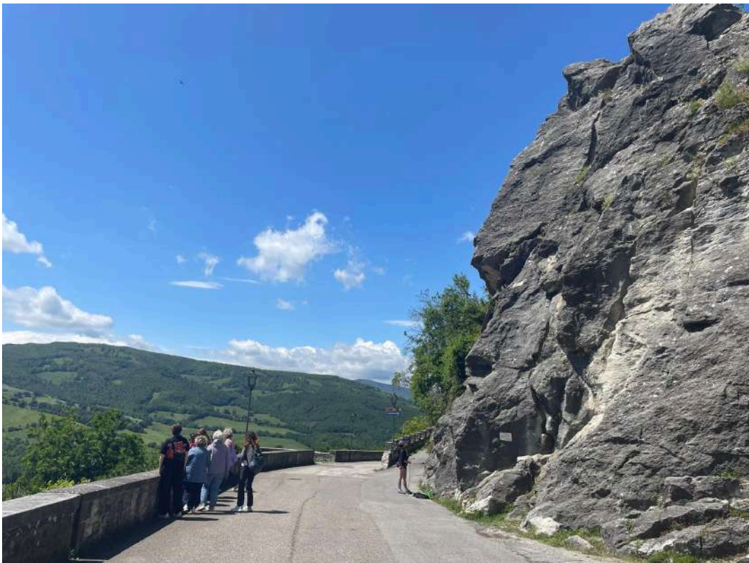
18 mai 2025 : Sortie à Pennabilli pour la Journée de la Biodiversité